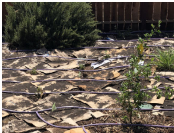
Capa #3 (mantillo) cubre las capas #1 y #2