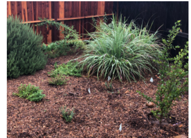
Lugar ajardinado cultivado con la capa #4 (mantillo de trocitos de madera) encima de todas las capas