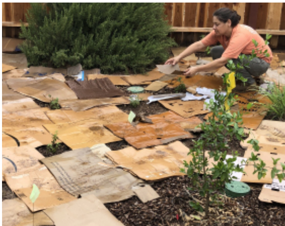
Capa #1 (mantillo) debajo de la capa # 2 (barrera)